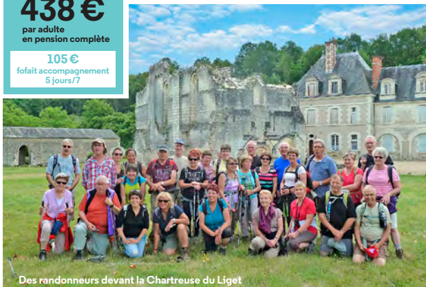
Des randonneurs devant la Chartreuse du Liget