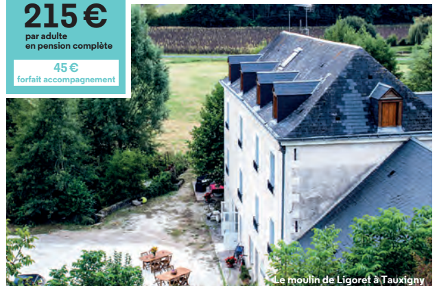
Le moulin de Ligoret à Tauxigny

“La Saulaie vous accueille au cœur de la Touraine. Venez découvrir nos châteaux, nos villages typiques ainsi que nos vignobles.”